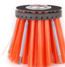
Terrazza Weedee® Unkrautentfernungsbürste