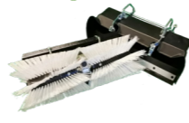
Terrazza Axi® Walzenbürste