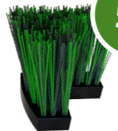
4. Geotex XL® Bürstenelement zur Reinigung des Bodentuchs