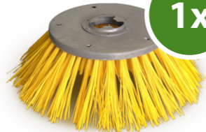
6. Terrazza Sweeper® Kehrbürste für Pflanzenreste, Schmutz etc..