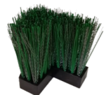
Terrazza XL® Bürsten elemente