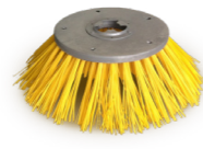
Terrazza Sweeper® Kehrbürste