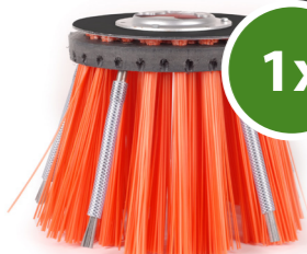
5. Weedee® Bürste Entfernt Unkraut und Moose von den Oberflächen und den Fugen.