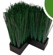
3. Terrazza XL® Blockelement für die Reinigung jeder Art von Oberfläche